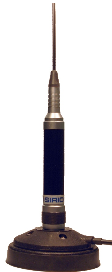
SILVER 90 MAG